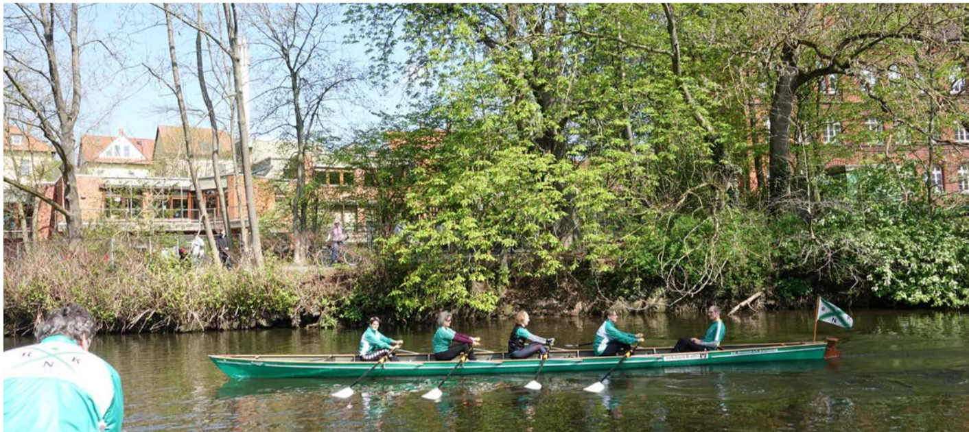
Der neue Wandervierer des Ruderclubs Normannia im ersten Einsatz

Bootstaufe mit Sekt: Der Braunschweiger Ruder-Klub „Normannia“ weihte im Zuge des Anruderns am 23. April sein neues Ruderboot ein und taufte es am Bootshausgelände auf den Namen „Kogge“. Der in den Vereinsfarben strahlende Vierer wird zum Wanderrudern genutzt. Für diese Art des Ruderns werden breite, unempfindliche Boote benötigt, da Gepäck mit transportiert werden muss oder keine Stege für den Ein- bzw. Ausstieg zur Verfügung stehen.