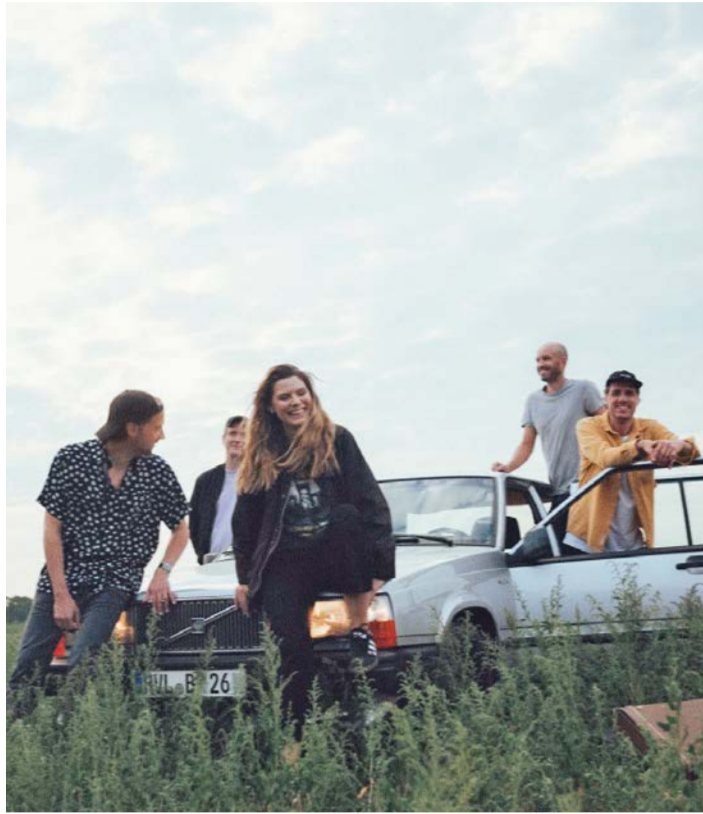
Deutsche Chartstürmer auf der BRAWO OPEN Bühne: Juli (l.) und Culcha Candela.

Zauberei boomt seit Harry Potter und den Ehrlich Brothers. Ungewöhnlich, für viele Besucher