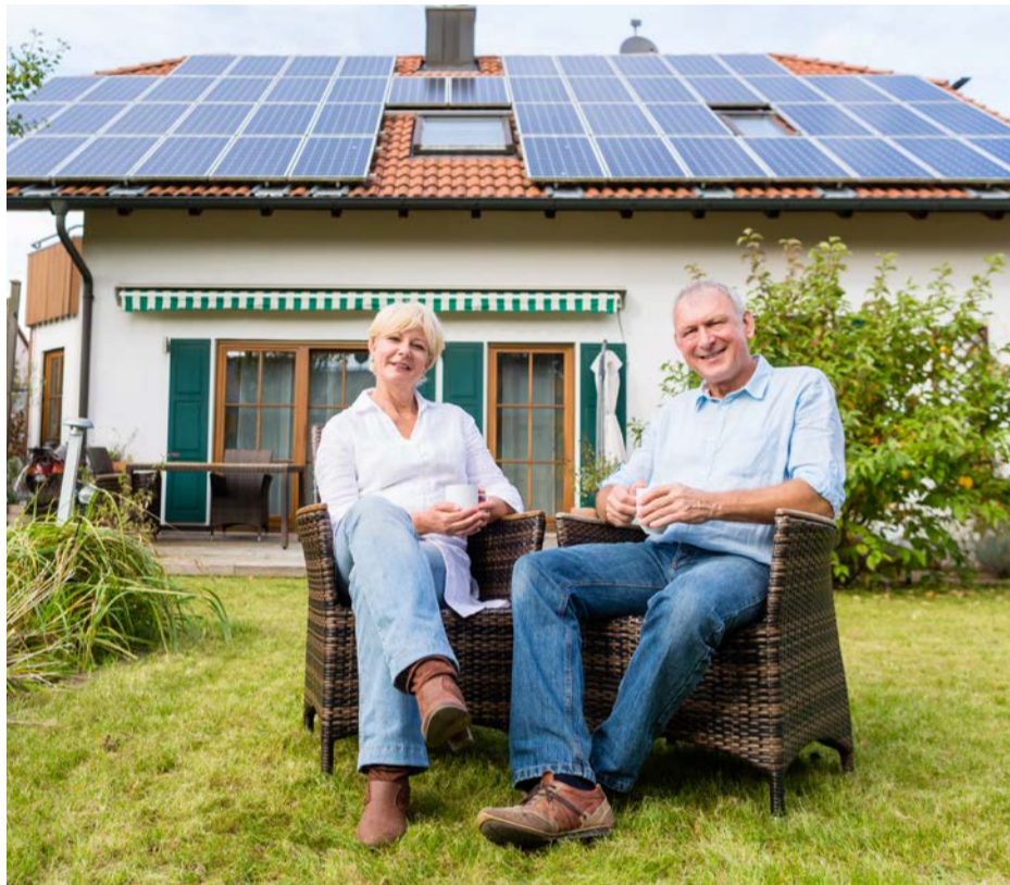
Auch im Alter ist die Modernisierung des Hauses eine sinnvolle Investition.

Mehr Informationen rund um das Thema Bausparen finden Sie unter volksbank-brawo.de/bausparen , zu den Kundenveranstaltungen unter volksbank-brawo.de/bauherrenseminare oder vor Ort bei den Baufinanzierungsexperten in unseren Filialen.