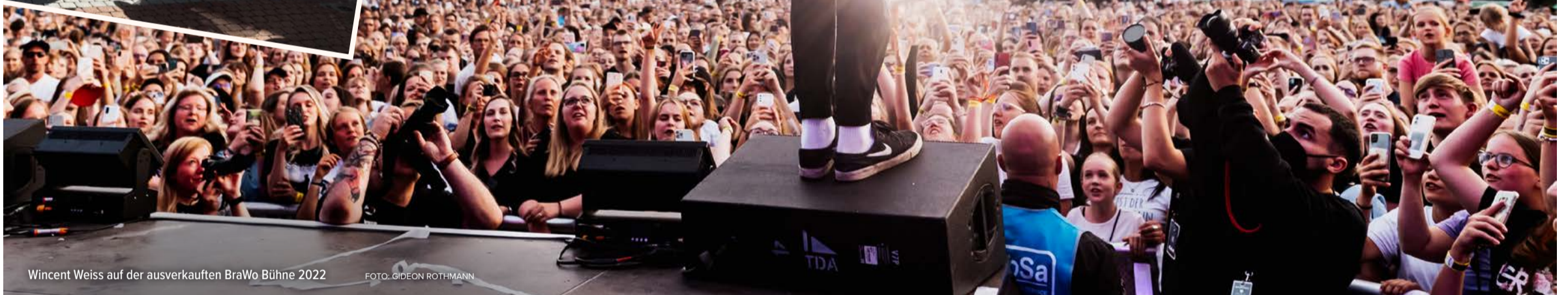
Wincent Weiss auf der ausverkauften BraWo Bühne 2022