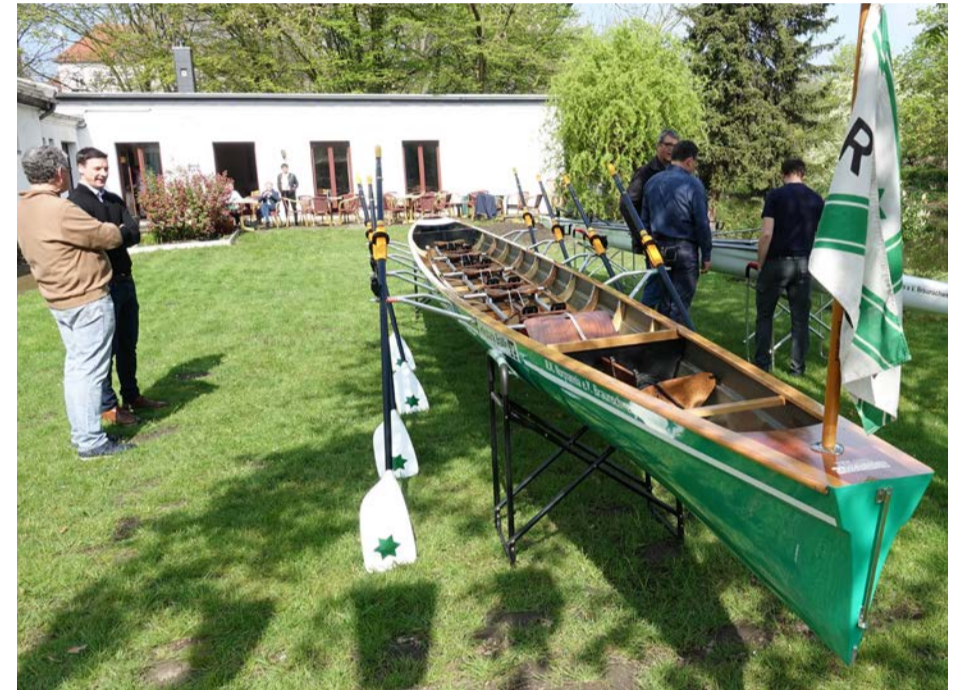
Das Ruderboot bei der offiziellen Taufe

Für zahlreiche gemeinnützige Projekte können Sie zudem auf der Crowdfunding-Plattform spenden unter www.viele-schaffen-mehr.de/brawo-spendenplattform .