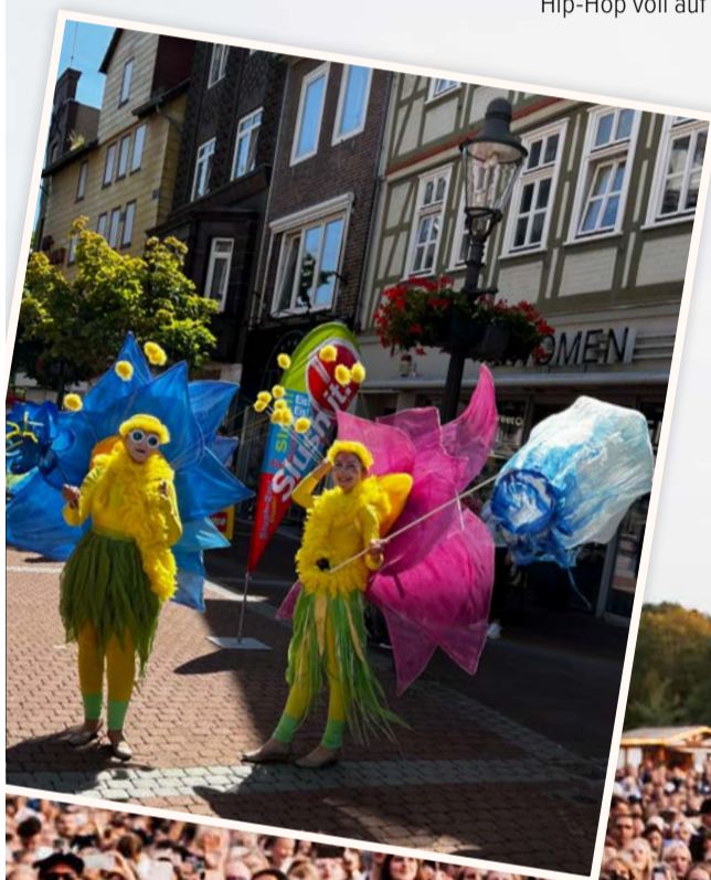
Der Mobility Summer in Peine wird bunt und abwechslungsreich.