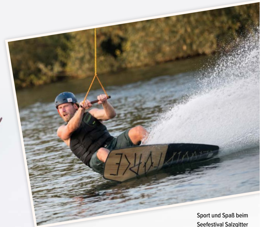
Sport und Spaß beim Seefestival Salzgitter

Auch 2023 findet am Salzgittersee wieder das BraWo-Seefestival statt. Am letzten August-Wochenende wird es unter anderem zu einer Neuauflage des beliebten „Salzig Bandcontest“, dem größten Bandwettbewerb der Region, bei dem die beste Band beziehungsweise der/die beste Solokünstler/-in gesucht wird, kommen. Verschiedene lokale Partner bieten ein vielfältiges Programm von sportlichen Aktivitäten, Unterhaltung und einem bunten Kinderprogramm inklusive Hüpfburgenpark.