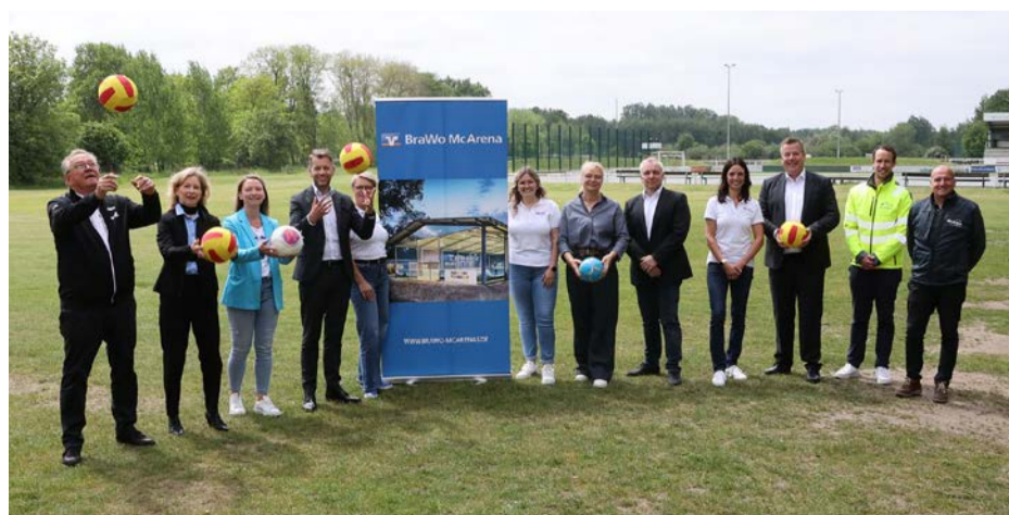
Es kann losgehen: Baustart für die Freilufthalle in Wolfsburg-Vorsfelde.

Die BraWo McArena Wolfsburg wird die dritte ihrer Art in der BraWo-Region sein. Im Juni 2020 ging die erste Arena in Gifhorn in Betrieb, worauf im Oktober 2022 die zweite in Peine folgte. Interessierte können sich im Internet unter www.brawo-mcarenas.de informieren. Buchungen sind ausschließlich online über die Webseite möglich.