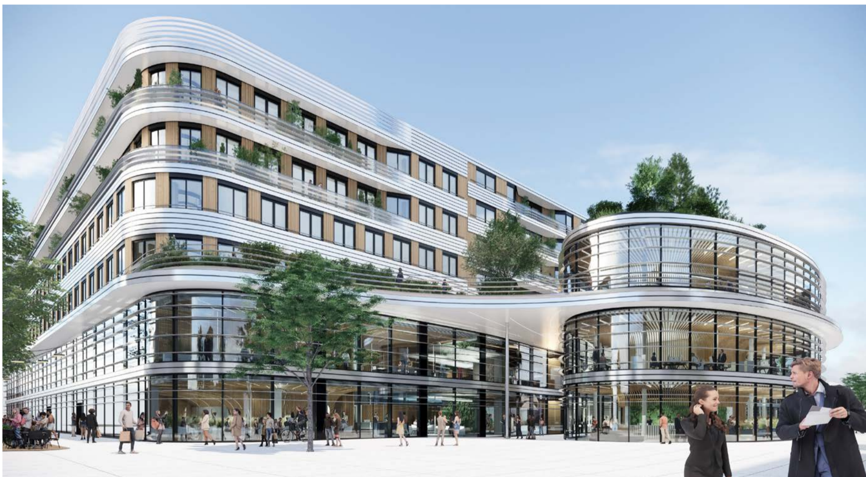
Gastronomie, Büroflächen und ein nachhaltiges Konzept sind Teil der BraWo Arkaden.

Sie können Reisegeld zu den aktuellen Umtauschkursen der ReiseBank direkt über das Online-Banking bestellen. Die gewünschte Währung wird in der Regel innerhalb der nächsten zwei Werktage geliefert. So können Sie Ihre Reisekasse ganz bequem von zu Hause aus zusammenstellen.